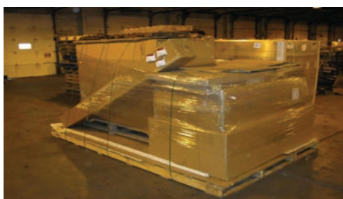
100L x 68l x 52H, cubé à: 100L x 96l x 96H.