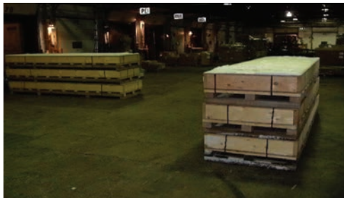
2 palettes = 104L x 46l x 50H: référez-vous aux règles de longueur excessive du guide de référence du cubage afin de déterminer le cubage exact.